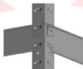
Узел крепления полки